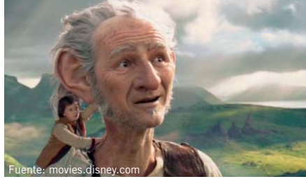
Mark Rylance interpreta al gigante