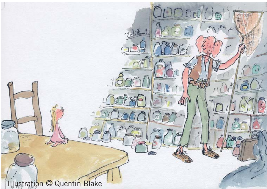
Ilustración © Quentin Blake

Las novelas juveniles de Roal Dahl han pasado a formar parte del imaginario colectivo gracias a las ilustraciones de Quentin Blake. Toda una generación de pequeños lectores tiene grabadas en su mente las imágenes que acompañaban las páginas de las novelas de Dahl ¿Cuál de las dos películas crees que le hace mayor referencia?