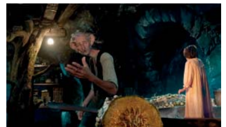
Mi amigo el gigante (The BFG, Steven Spielberg 2016)