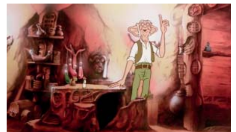
El buen amigo gigante (The BFG, Brian Cosgrove 1989)

Efecto de profundidad que se consigue a partir de imágenes planas diferenciándolas para cada ojo. Hoy en día se aplica en cine mediante el uso de gafas.