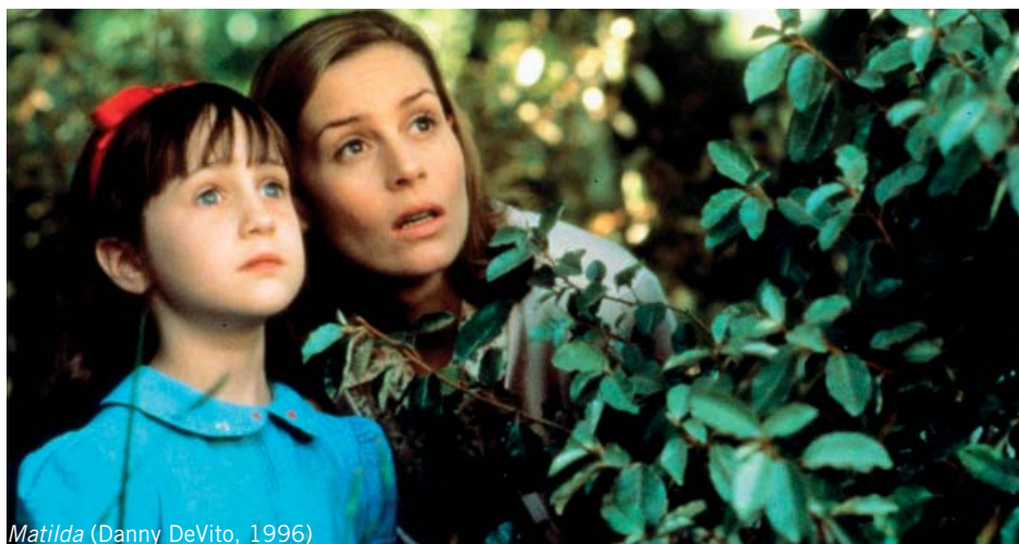
Matilda (Danny DeVito, 1996)

ISABEL DE INGLATERRA la reina de Inglaterra se encariña pronto con Sophie y su amigo el gigante. Les ayudará a defender el mundo del resto de gigantes