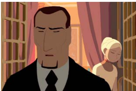
PADRE DE SASHA