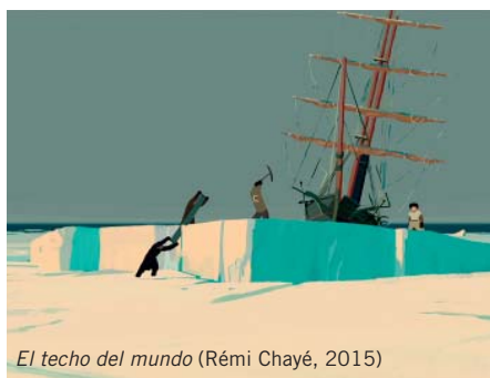
El techo del mundo (Rémi Chayé, 2015)