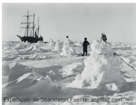
Expedición de Shackleton.