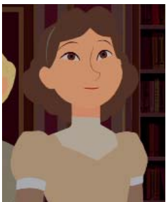
AMIGA DE SASHA