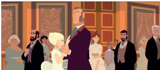
ALTA SOCIEDAD EN SAN PETESBURGO