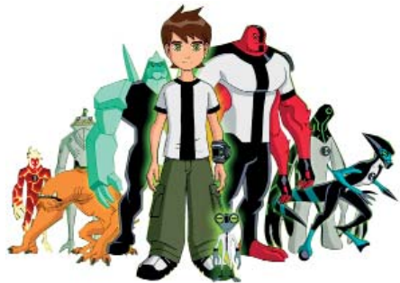
3. BEN 10