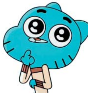
6. EL ASOMBROSO MUNDO DE GUMBALL