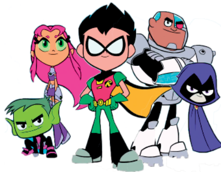
5. TEEN TITANS