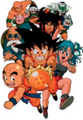
1. DRAGON BALL Z

¿Recuerdas los elementos que caracterizaban el dibujo de personajes del anime? ojos grandes, cabello puntiagudo, piernas muy largas, expresiones faciales muy exageradas... Los siguientes dibujos, vistos en TV en numerosos hogares de occidente, forman ya parte de nuestra cultura visual. Estamos tan acostumbrados que no reparamos en que son anime ni en la influencia que han tenido en las producciones norteamericanas o europeas ¿o sí? ¿sabrías decir cuáles son anime y cuáles no?