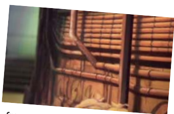
fragmento 2 CASILLA ____