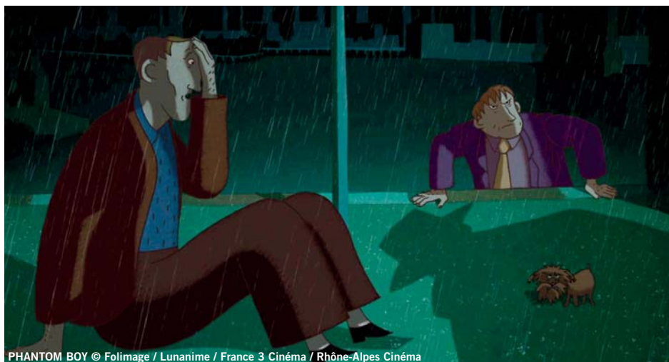
PHANTOM BOY © Folimage / Lunanime / France 3 Cinéma / Rhône-Alpes Cinéma

El claroscuro da una expresividad particular a la imagen. Al dejar partes de la imagen en luz y partes en sombra, proporciona un halo de misterio muy apropiado para las películas de suspense* . En ocasiones las sombras dan incluso más información que las luces. Por ejemplo... ¿cuántas personas hay en esta imagen? Una pista: no son dos.