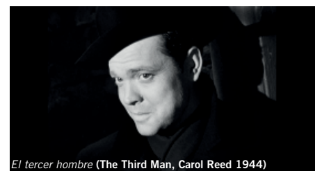
El tercer hombre (The Third Man, Carol Reed 1944)