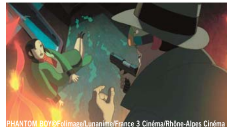
PHANTOM BOY

¿Podrías decir en qué fotograma el ángulo es picado y en cual contrapicado? ¡Ten cuidado, se ha colado un fotograma trampa!