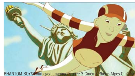
PHANTOM BOY © Folimage / Lunanime / France 3 Cinéma / Rhône-Alpes Cinéma