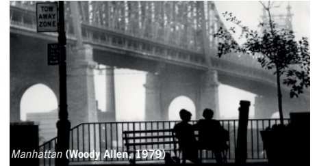
Manhattan (Woody Allen, 1979)