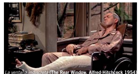
La ventana indiscreta (The Rear Window, Alfred Hitchcock 1954)