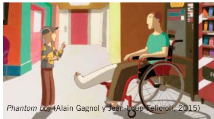
Phantom boy (Alain Gagnol y Jean-Loup Felicioli, 2015)

La unión de referentes clásicos con otros más actuales forma parte del estilo de Alain Gagnol y Jean-Loup Felicioli, y es una de las claves para conseguir acercar el género negro a niños y niñas.