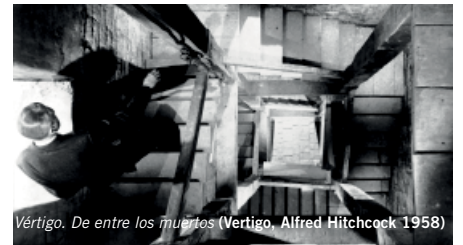
Vértigo. De entre los muertos (Vertigo, Alfred Hitchcock 1958)