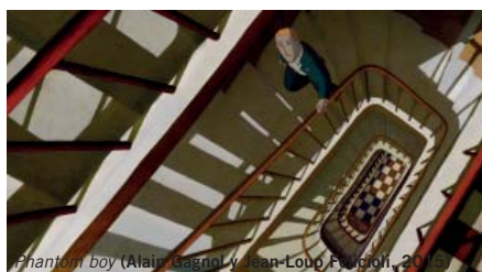
Phantom boy (Alain Gagnol y Jean-Loup Felicioli, 2015)