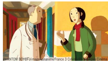
PHANTOM BOY © Folimage / Lunanime / France 3 Cinéma / Rhône-Alpes Cinéma