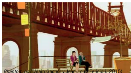
Phantom boy (Alain Gagnol y Jean-Loup Felicioli, 2015)