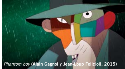
Phantom boy (Alain Gagnol y Jean-Loup Felicioli, 2015)