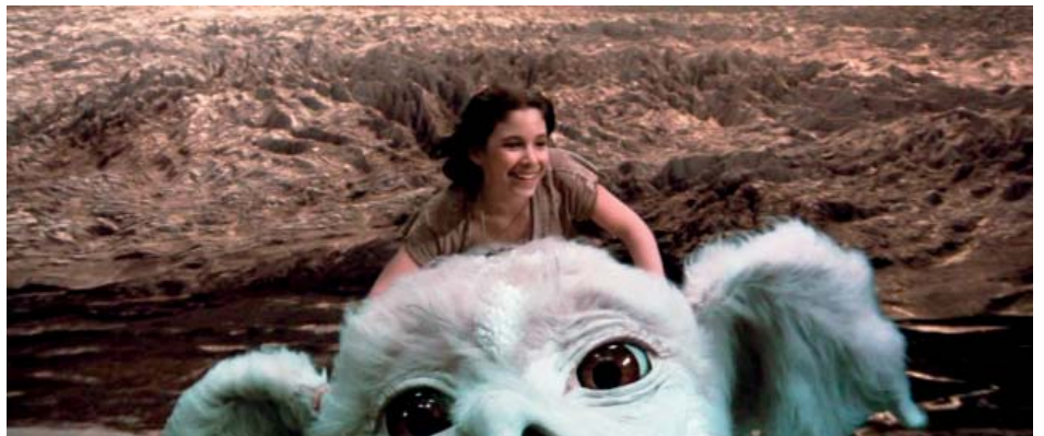
Las tomas aéreas del paisaje fueron rodadas independientemente y añadidas al fondo después.