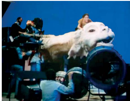
Set de rodaje con Chroma Key azul

Dibuja por donde le imaginas viajando a lomos de Fújur ¿Cómo lo rodarías?