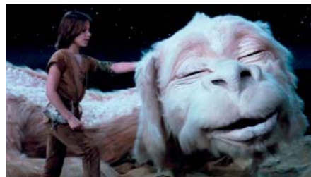
Fújur en compañía de Atreyu