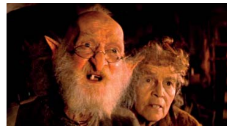
Los gnomos Enguivuck y Urgl