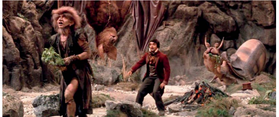
De izda. a dcha: Elfo de la noche, Murciélago, Teeny Weeny y Caracol Veloz Al fondo: Monstruo Comepiedras