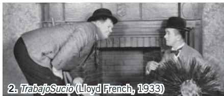
2. Trabajo Sucio (Lloyd French, 1933)