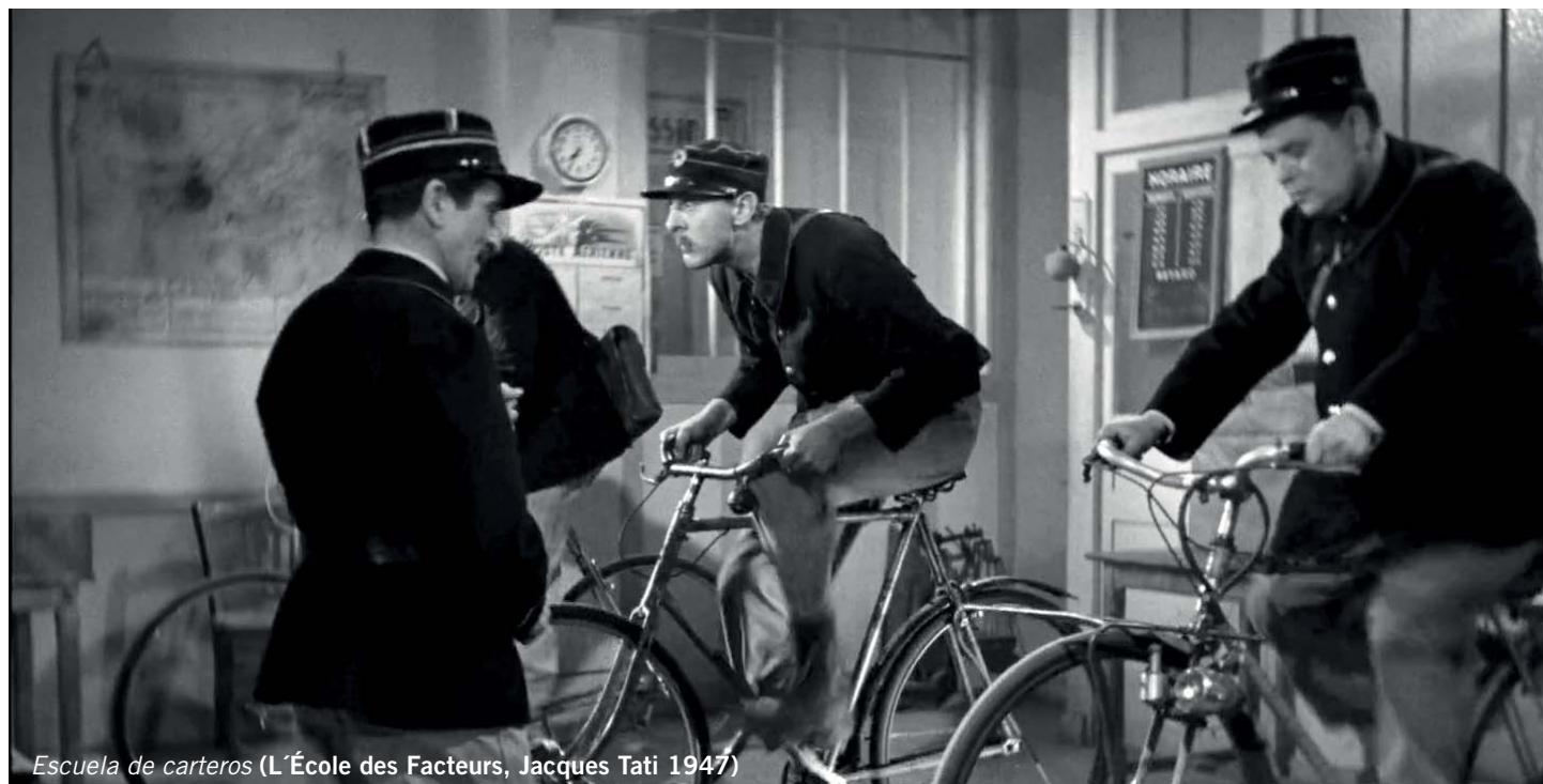
Escuela de carteros (L'École des Facteurs, Jacques Tati 1947)