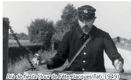
Día de fiesta (Jour de Fête, Jacques Tati 1949)

Una de las diferencias más importantes es la posibilidad que no tenían las películas cómicas clásicas de utilizar el color. Tati hacía uso de él para dotar de mayor sentido a sus películas, no sólo para que fueran más realistas. Quiso introducirlo desde su primer largometraje, Día de fiesta (1949), que fue rodada con dos tipos de cámaras: una en color y otra en blanco y negro. Sin embargo tuvo que estrenarse en blanco y negro porque el sistema de grabación a color que utilizó Tati era experimental y la película no pudo revelarse; hasta 1995 no se vio finalmente la versión en color.