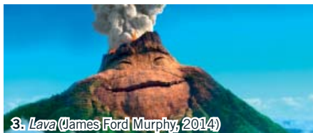
3. Lava (James Ford Murphy, 2014)