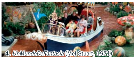
4. Un Mundo de Fantasía (Mel Stuart, 1971)