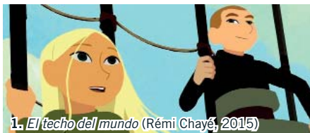
1. El techo del mundo (Rémi Chayé, 2015)