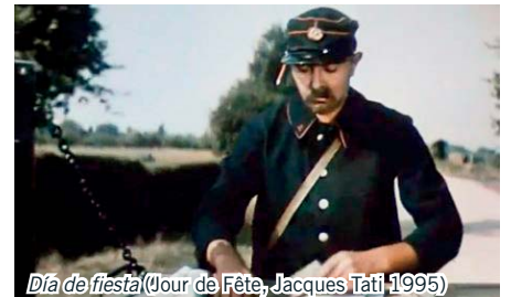
Día de fiesta (Jour de Fête, Jacques Tati 1995)

Otro avance significativo fue el sonido. En la época del slapstick no era posible rodar con sonido, un músico acompañaba en directo la proyección de la película. Para Tati la música era tan importante como la imagen, e integraba las voces con los sonidos, ruidos y la música de forma que complementaban los gags visuales y marcaban el ritmo del film.