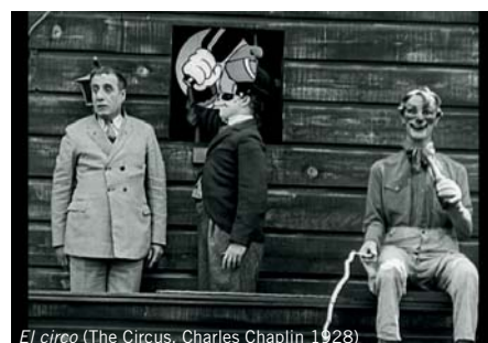
El circo (The Circus, Charles Chaplin 1928)