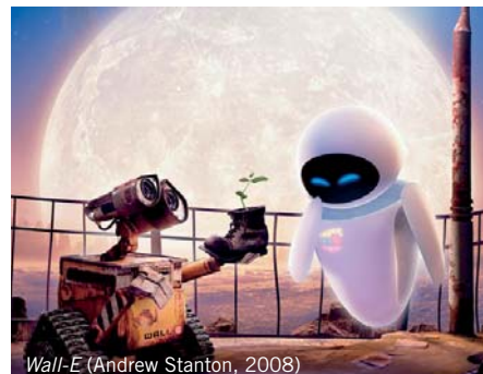
Wall-E (Andrew Stanton, 2008)