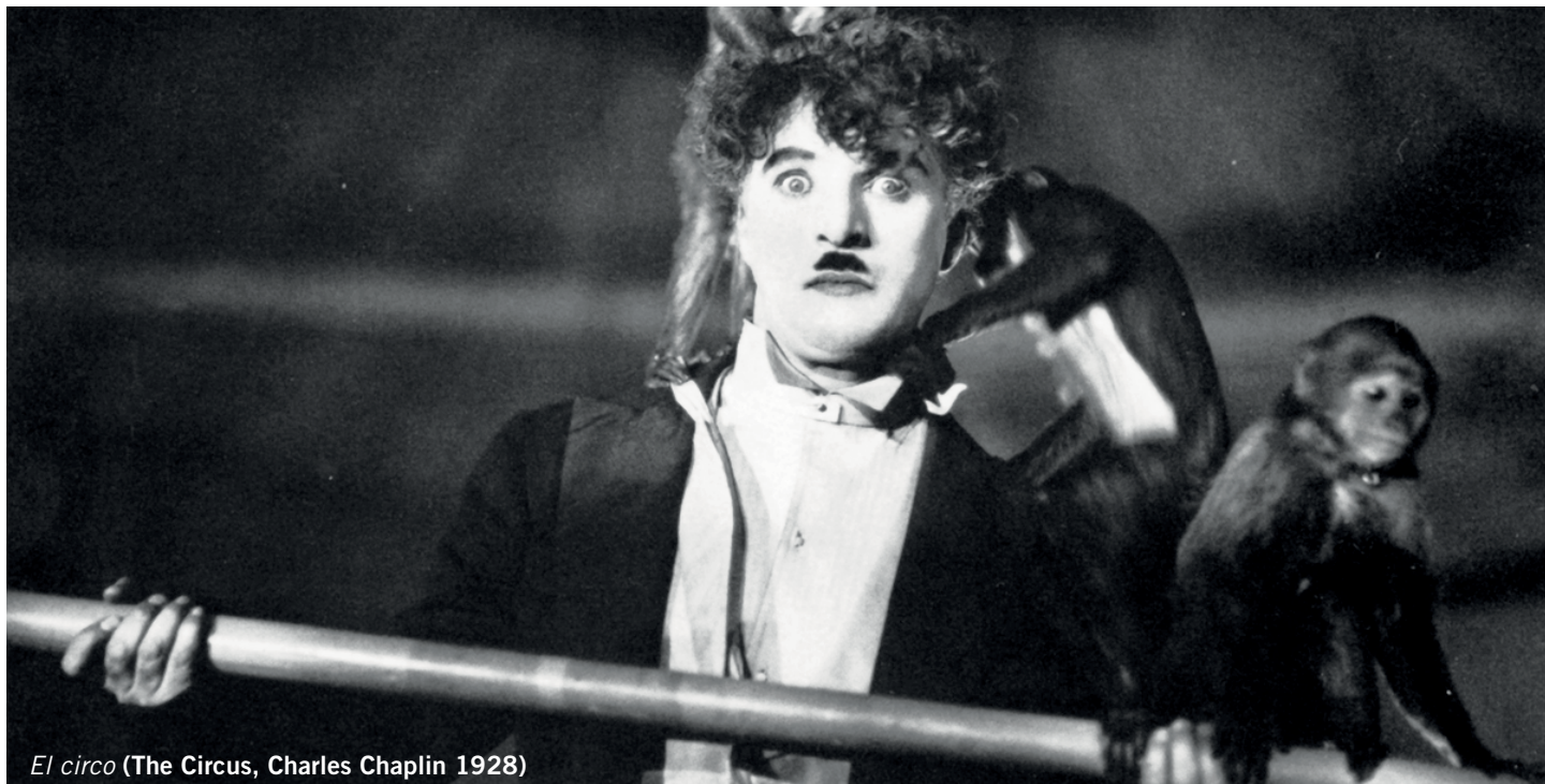
El circo (The Circus, Charles Chaplin 1928)