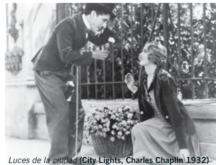
Luces de la ciudad (City Lights, Charles Chaplin 1932)

¿Serías capaz de indentificar al menos tres similitudes con el universo Charlot en la imagen de la derecha? ¿Y alguna más?