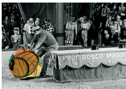
El circo (The Circus, Charles Chaplin 1928)

Algunos elementos son tan similares que se nos han mezclado en las siguientes imágenes y con las prisas no nos ha dado tiempo a reorganizarlas ¿Nos ayudas?